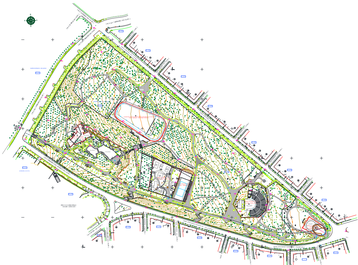
Τοπογραφικό διάγραμμα τροποποίησης σχεδίου στο ΟΤ 182 (Πάρκο Παπάγου)

Το ΟΤ 180-181 εντάχθηκε στο ρυμοτομικό σχέδιο με το Δ/γμα περί τροποποίησης ρυμοτομικού σχεδίου ΦΕΚ 19/Δ'/1953. Στο πρώην ΟΤ 181 προβλεπόταν χρήση «Κοινωνικών Κέντρων» με δύο κόκκινα περιγράμματα επιφάνειας 222,00 τμ. και 298,00 τμ. περίπου. Με το ΦΕΚ 94/Δ'/1964 τα δύο ΟΤ 180 & 181 ενοποιήθηκαν σε ένα και αποτελούν το ΟΤ 180-181.