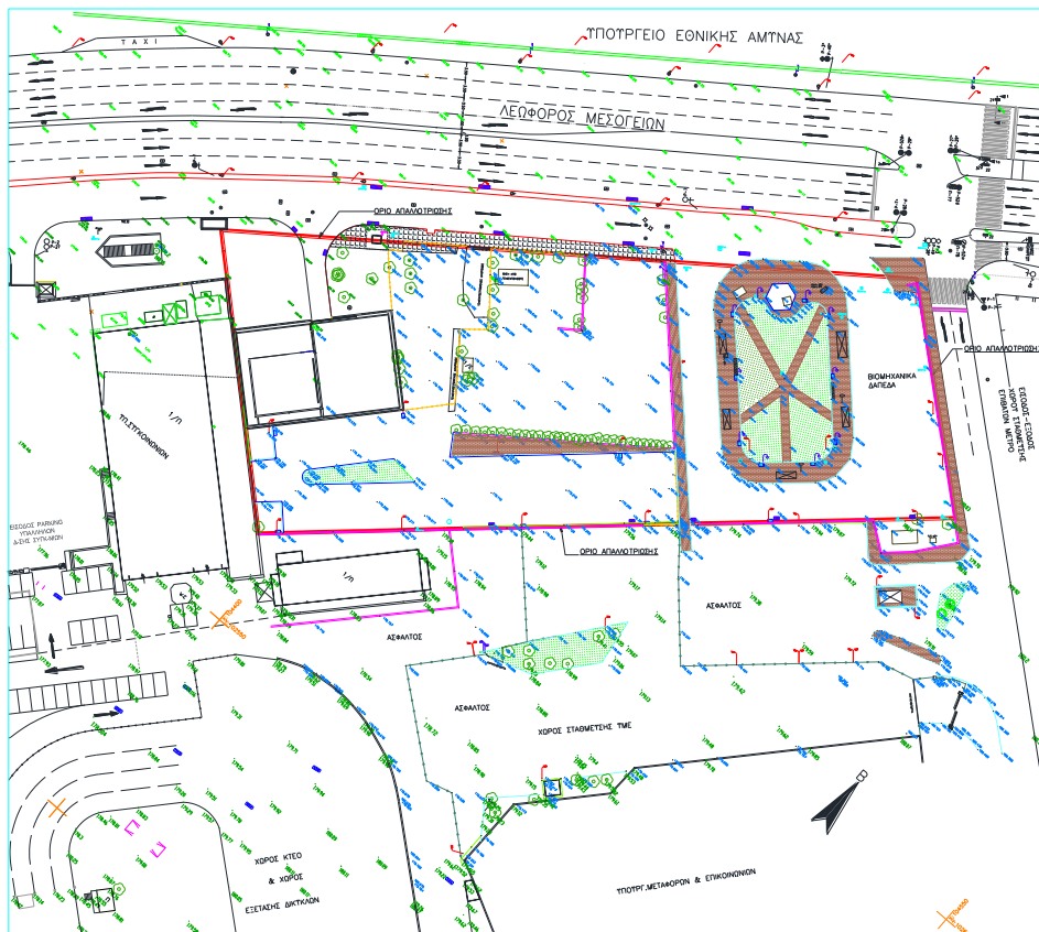
Τοπογραφικό διάγραμμα του ανοιχτού χώρου στάθμευσης της Αττικό Μετρό ΑΕ.

Σύμφωνα με τα παραπάνω η Αττικό Μετρό ΑΕ, έχει ήδη απαλλοτριώσει έκταση 7.613 τμ., προκειμένου για την κατασκευή Υπαίθριου Χώρου Στάθμευσης εντός του ΟΤ 189, το οποίο σύμφωνα με το Β.Δ. 4-9-1968 (Δ' 182) είναι «χώρος για την ανέγερση κτηρίου του Υπ. Συγκοινωνιών» στον παλιό χώρο της αφετηρίας Λεωφορειακών γραμμών του ΟΑΣΑ.