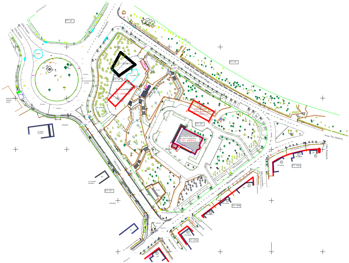
Τοπογραφικό διάγραμμα τροποποίησης σχεδίου στο ΟΤ 180-181

Η τοποθέτηση του κτηρίου στη θέση που προτείνεται από τον Ι.Ν. Αγ. Σκέπης βρίσκεται στο χώρο του παλαιού ΟΤ 180 και ανήκει στην ιδιοκτησία του Δήμου Παπάγου - Χολαργού. Η περιοχή βρίσκεται εντός των ορίων Ζώνης Δ1 Μητροπολιτικού Πάρκου Γουδή σύμφωνα με τα Διατάγματα Προστασίας του όρους Υμηττού (ΦΕΚ 187/Δ'/2011 και το νέο, υπό έγκριση, Π.Δ.).