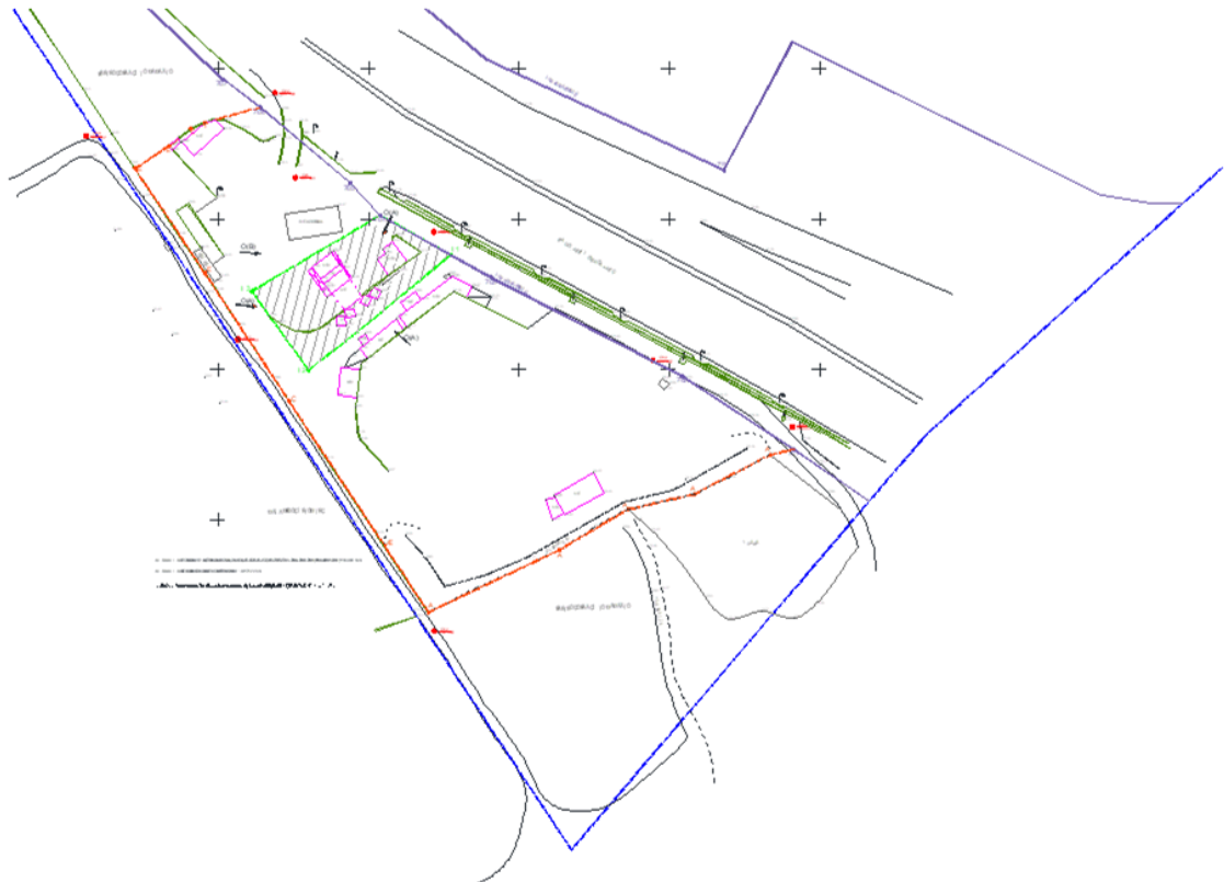
Ιδιοκτησία Δήμου Παπάγου- πρώην εργοτάξιο Αττικό Μετρό ΑΕ