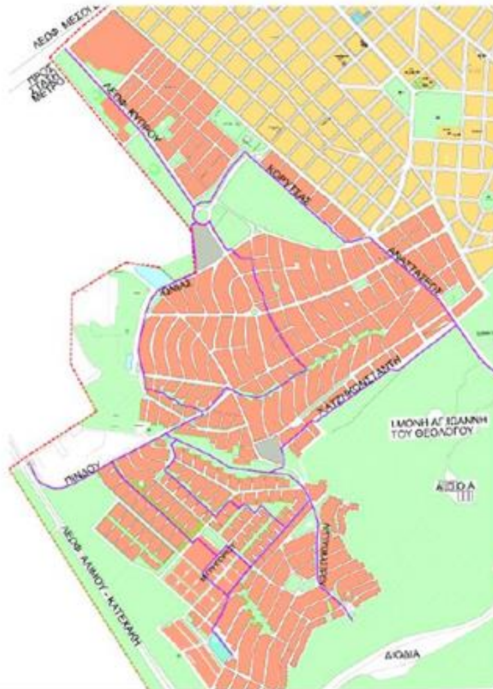
Δημιουργία ποδηλατοδρόμων στο Δήμο Παπάγου, μελέτη 2004

Διαθέτει περιορισμένο δίκτυο ποδηλατοδρόμου, το οποίο προέκυψε από την εν μέρει υλοποίηση μελέτης του Εθνικού Μετσόβιου Πολυτεχνείου του 2004 με θέμα «Δημιουργία ποδηλατοδρόμων στο Δήμο Παπάγου». Η μελέτη αυτή περιλάμβανε ένα εκτενές δίκτυο ποδηλατοδρόμων όπως φαίνεται στην παρακάτω Εικόνα που όμως υλοποιήθηκε σε πολύ μικρό βαθμό.